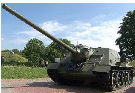
Истребитель танков — специализированная, полностью и хорошо бронированная