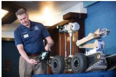
Следующее поколение беспилотных наземных машин легче, быстрее, сильнее и умнее

Remotec Inc., дочернее предприятие Northrop Grumman Corporation, начнет в декабре поставки Titus, новейшего и самого маленького члена их линейки беспилотных наземных машин (UGV) Andros.