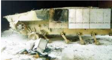
Фото НИИ Стали, 1999г.

Рис.5. Результат попадания гранаты ПГ-9В в блок левой секции ДЗ БМП-3с ЭДЗ 4С20. Пробития брони нет, но выведены из строя 6 блоков ДЗ, включая 3 нижних.