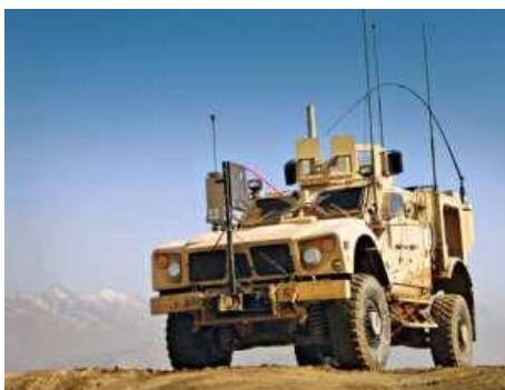
Американская компания Oshkosh Corp. Получила контракт стоимостью $ 97 146 579 на 177 машин с защитой от мин и засад повышенной проходимости с установленным пакетом