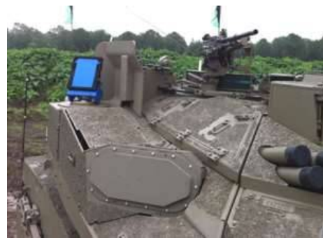
Израильские исследования в области систем активной защиты (Active Protection Systems - APS) продолжаются более двух десятилетий.

Их инициировал головной офис программы Merkava, который находится в ведении министерства обороны и корпус боеприпасов ЦАХАЛа, понимая, что израильский танк достиг потолка допустимой массы, и его защищенность не может быть повышена путем увеличения пассивной или реактивной защиты. А это крайне необходимо, чтобы соответствовать меняющимся угрозам, в частности, в асимметричных конфликтах, где поражение может произойти с любого направления.