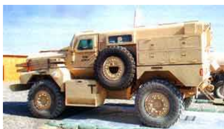
Force Protection, Inc, ведущий американский разработчик и производитель решений в области живучести и поставщик полной поддержки