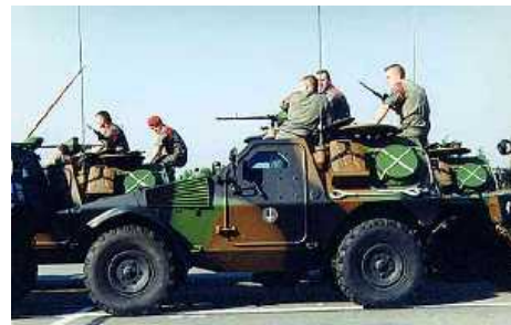
Серийное производство легкой боевой машины (Vehicule Blinde Leger, VBL) M11 продолжается, в первую очередь для закупок французской армией.

В 2002 году французская армия разместила заказ на 500 таких машин. В апреле 2006 года ею же были заказаны дополнительно 91 разведывательная машина VBL2L. Общий планируемый заказ VBL для французской армии на сегодня превышает 1600 машин.