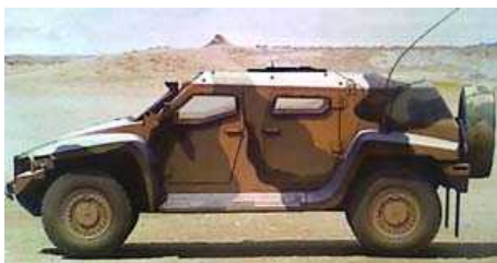
Легкая бронированная высококомбинная машина Hawkei разработана фирмой Thales (Австралия) в сотрудничестве с другими ведущими компаниями.

Машина имеет колесную формулу 4x4 при массе 7 тонн. Спроектирована в соответствии с техническими требованиями проекта Project Land 121, этап 4, стоимость программы оценивается в сумму порядка $ 4,1 миллиарда. Программа ставит своей целью заменить 1300 машин общего назначения в австралийской армии (из общего парка в 4700 машин), на бронированные машины (БМ), которые могут использоваться для боевых операций.