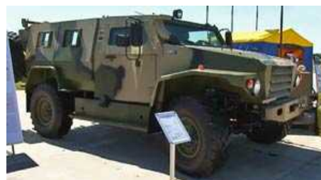
Военно-промышленная компания (ВПК), которая является подразделением холдинга «Русские