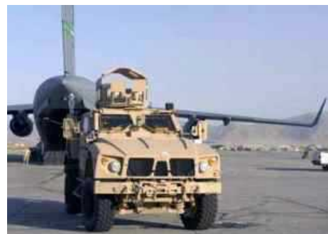
Вездеход с защитой от мин и засад, или М-ATV, находится на пути в Афганистан, чтобы заменить там большое количество бронированных Хаммеров.

"Пройдет совсем немного времени, прежде чем мы сможем пересадить всех с бронированных Humvee на MRAP ATV", сказал заместитель начальника генерального штаба США, генерал Питер В. Чиарелли.