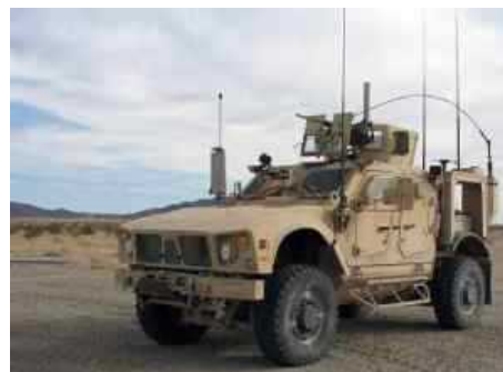
Парк армии США пополнился машинами, которые оснащены встроенными сетевыми комплектами связи (NIK).

вторичного поражения осколками в случае пробития основной брони БТР. Помимо повышения защитных свойств, установка противоосколочной защиты улучшает термо- и шумоизоляцию обитаемого отсека бронетранспортера, а также его эргономику.