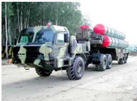
Закрытое акционерное общество Брянский автомобильный завод (ЗАО БАЗ), участвующее в

1-м Международном Форуме Технологии в машиностроении-2010 (30 июня – 4 июля, ТВК Россия, г. Жуковский), на IV Международном Салоне вооружения и военной техники МВСВ-2010, который пройдет в рамках Форума, представит натурные образцы седельного и балластного тягачей, двух специальных колесных шасси и ремонтно-эвакуационной машины на специальном колесном шасси.