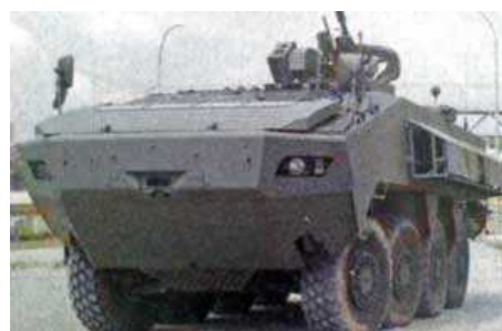
БТР Terrex 8x8 созданный Singapore Technologies Kinetics (STK), будет производится для Вооруженных Сил Сингапура.

Компания намеревается первую партию в 135 машин Terrex, поставить в 2010 году и затем нарастить производство до 8 машин в месяц, чтобы завершить поставку в середине 2011 года.