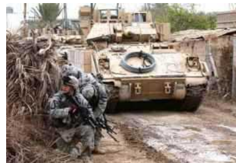
Армия США подписала с фирмой BAE Systems контракт на $ 601 млн. на модернизацию части своих тяжелых машин пехоты.

В рамках партнерства с Army's Red River Army Depot (армейское подразделение), BAE Systems будет производить ремонт и модернизацию 606 боевых машин Bradley. Данные работы будут частью программы восстановления боеспособности подразделений армии США, которые пострадали во время выполнения заданий в Афганистане.