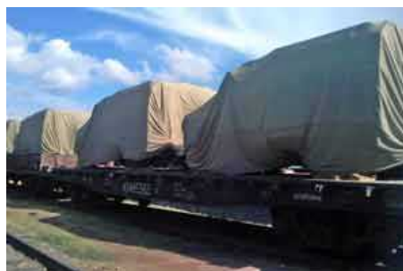
ООО «Военно-промышленная компания» отправила в Китайскую Народную Республику первую партию специальных полицейских машин СPM-2 «Тигр». На днях эшелон с техникой прибыл в Пекин.

В соответствии с контрактом, предусматривающем поставку ООО «Военно-промышленная компания» в КНР специальных полицейских машин СPM-2 «Тигр» эшелон с первой партией машин прибыл в Пекин. В составе эшелона для китайских полицейских доставлены пять готовых машин, и еще пять машино-комплектов из которых будут собираться «Тигры» непосредственно в Китае на одном из предприятий Пекинской автомобильной компании «Чжун Цзы-Янь Цзинь». До конца текущего года «Военно-промышленная компания» должна поставить в КНР в общей сложности 100 «Тигров», 90 из которых будут собраны в Китае. В настоящее время на «Арзамасском машиностроительном заводе» готовы к отгрузке еще 15 машин и машино-комплектов. Еще 35 машин и машино-комплектов ожидают приемки китайскими специалистами, которые должны прибыть в Арзамас в самое ближайшее время.