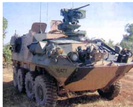
Австралийские Вооруженные Силы (ADF) получили девять новых дистанционно управляемых боевых модулей Protector фирмы Kongsberg.

Системы Protector будут поставлены в феврале 2005 года. Подразделением ADF в мельбурне они будут установлены на бронетранспортере 8x8 ASLAV, австралийском варианте американских Stryker.