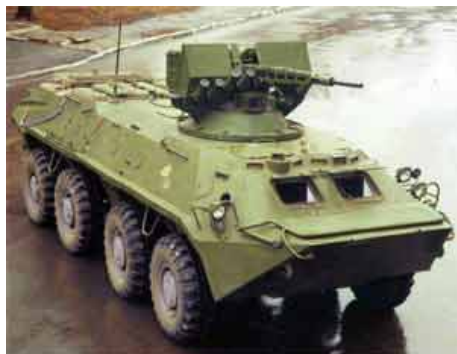
Завершились государственные испытания модернизированного бронетранспортера БТР-70, который получил название Скиф.

В модернизированном бронетранспортере вместо двух карбюраторных двигателей ЗМЗ-4905 российского производства установлен дизель УТД-20, который производится на Украине.