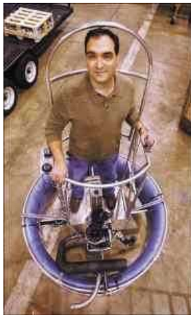
Американская фирма Air Vuoyant работает над летательным аппаратом, который может использоваться в качестве БПЛА, а также как летающий автомобиль.

Основатель и руководитель компании является также учредителем фирмы Xtreme Alternative Defense Systems (XADS), которая занимается разработками для Министерства обороны США нелетальным оружием, а также системами защиты от самодельных взрывных устройств в Ираке и Афганистане, на что ей уже было выделено 10 миллионов долларов.