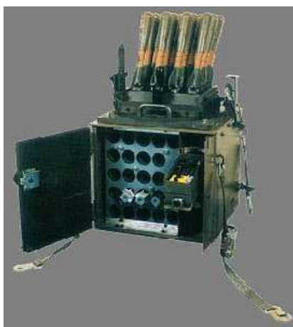
Немецкая фирма Rheinmetall на выставке Milipol в Париже продемонстрировала низкопрофильную систему вооружения Fly-K.

Сегодня вооруженные силы проводят большое количество операций по всему миру, при этом подвергаясь большому количеству разнообразных угроз. Сохранение низкого профиля при этом продолжает оставаться важным условием выживания на поле боя. Оно дает возможность поразить противника до того момента, как он сможет обнаружить вашу позицию, а также позволяет дружественным боевым единицам вести огонь поверх вашей позиции.