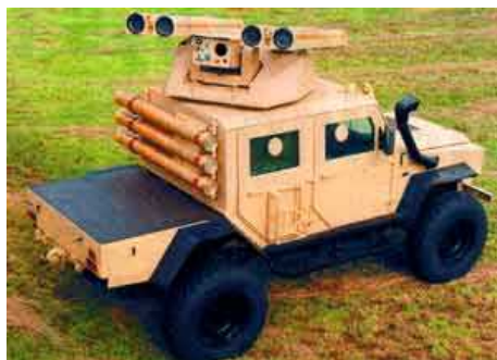
Компания Denel произвела установку дальнобойной разведывательной бронированной башни с дистанционным управлением (ALRRT) на

бронетранспортер с усиленной противоминной защитой RG-32M, производства BAЕ Systems Land Systems OMC.