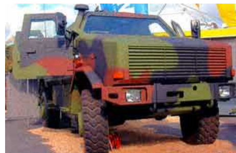
Бельгия разместила 8 многоцелевых бронированных машин (MPPV) Dingo2 с колесной формулой 4x4 в Ливане и в апреле планирует разместить эти же машины в Афганистане.

Бельгия приняла первые поставки Dingo2 в конце 2006 года в рамках программы по модернизации бронированных машин.