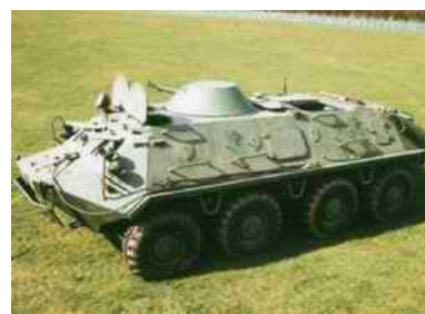
Бронетранспортёр (БТР) — боевая бронированная машина, предназначенная для транспортировки личного состава к переднему краю.

Родственными бронетранспортёру машинами являются боевые машины пехоты (БМП). Как правило, БМП отличается от БТР лучшей защитой и более высокой огневой мощью, хотя, в последнее время разработаны варианты гусеничных БТР на базе танков с противоснарядным бронированием и различия между гусеничными БТР и БМП по их боевым свойствам практически исчезли. Визуально отличить такой БТР от БМП можно только по