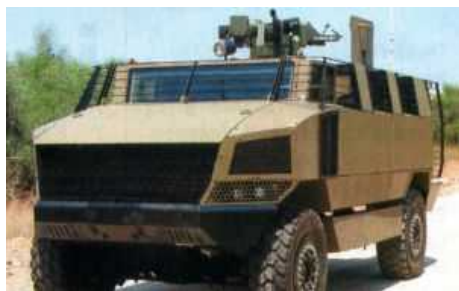
Бронированная машина «Golan» разработана для боевых операций в городских условиях по запросу Сил Оборона Израиля.

Фирма Rafael (Израиль) и фирма Protected Vehicle Inc. (шт. Южная Каролина, США) - изготовитель машин, стойких к воздействию мин - объединили свои усилия по созданию новой бронированной боевой машины (БМ) с колесной формулой 4x4 для потенциальных заказчиков Израиля и США.