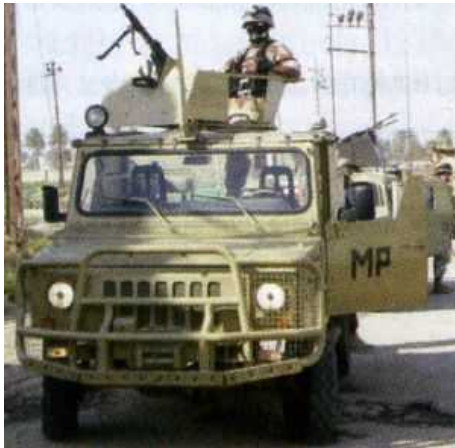
Польша подарила 10 легкобронированных патрульных машин Skorpion-3 8-ой дивизии иракской армии.

После завершения обучения в Многонациональном отделении центра «Юг», возглавляемого Польшей, 8-ая дивизия стала первым крупнейшим подразделением иракских наземных сил, находящимся под непосредственным оперативным командованием генерального штаба иракских вооруженных сил. Патрульные машины «Skorpion» будут использоваться ротой военной полиции этой дивизии.