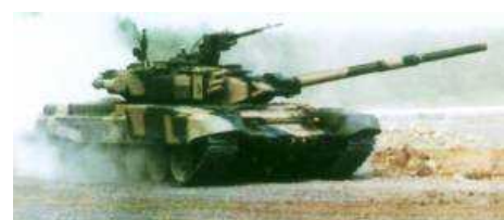
Россия подписала с Индией новый контракт на поставку 330 основных боевых танков Т-90С в виде полного комплекта всех составных частей.