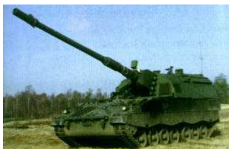
Впервые в боевых операциях применены 155-мм самоходные гаубицы PzH 2000, изготовленные фирмой Krauss-Maffei Wegmann (ФРГ).

В заявлении от 5 сентября 2006 г. Министерство Обороны (МО) Голландии заявило, что две из трех гаубиц PzH 2000, находившихся в провинции Урузган (южный Афганистан), передислоцировались в соседнюю провинцию Кандагар для поддержки канадского и афганского контингента войск численностью 2000 человек, принимающих участие в операции «Медуза».