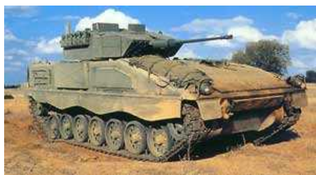
Греческая Армия планирует закупить 291 гусеничную боевую машину пехоты на общую сумму 2,1 миллиарда долларов США.

Новые БМП будут взаимодействовать с двумя укрупненными группами ОБТ, причем обе группы танков, поставляемые для греческой армии, включают в себя: