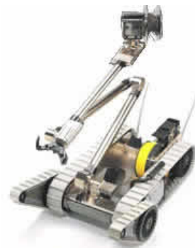
Агентство закупок и поставок вооружения