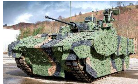
General Dynamics European Land Systems (GDELS) представит четыре своих новых разработки на Международной выставке EUROSATORY Defense & Security 2018, которая пройдет с 11 по 15 июня в Париже.

Среди прочего компания продемонстрирует два новых варианта семейства гусеничных машин ASCOD: