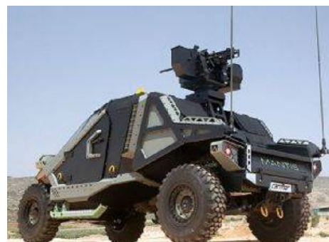
Производитель нового бронетранспортера Mantis,