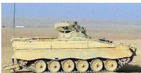
Правительство Германии заключило контракт с

компанией Rheinmetall на модернизацию еще 25 боевых машин пехоты Marder из избыточных запасов бундесвера. Машины предназначены для вооруженных сил Иордании. Поставка начнется в первом квартале 2018 года. Контракт был заключен в рамках программы военной помощи Германии, направленной на укрепление возможностей вооруженных сил Иордании в борьбе с международным терроризмом, а также для миссии по обеспечению безопасности и стабилизации границ. Забронированный в октябре 2017 года заказ стоит более 17 миллионов евро без налога на добавленную стоимость.