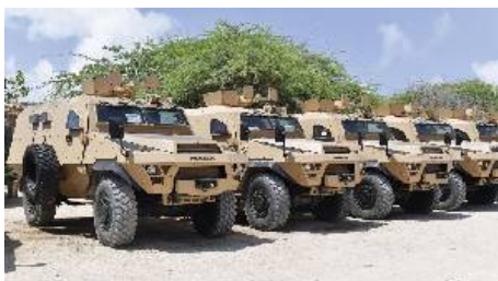
Миссия Африканского союза в Сомали (AMISOM)

объявила 25 сентября 2017 год, что ее угандийский контингент получил 19 новых боевых машин из Соединенных Штатов и опубликовала фотографии, показывающие бронетранспортеры Bastion производства АСМАТ, отмеченные, как продукция компании Mack.