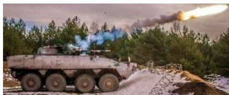
В башне ZSSW-30, которую польская компания

Концепция новой польской башни польского блока предполагает ее полную взаимозаменяемость с башней HITFIST-30P, т.е. новая ZSSW-30 должна устанавливаться на колесные боевые машины Rosomak без каких-либо изменений в корпусе. Обе башни имеют одинаковые погон и вращающееся контактное устройство. Кроме того, различия в распределении масс обеих систем будут